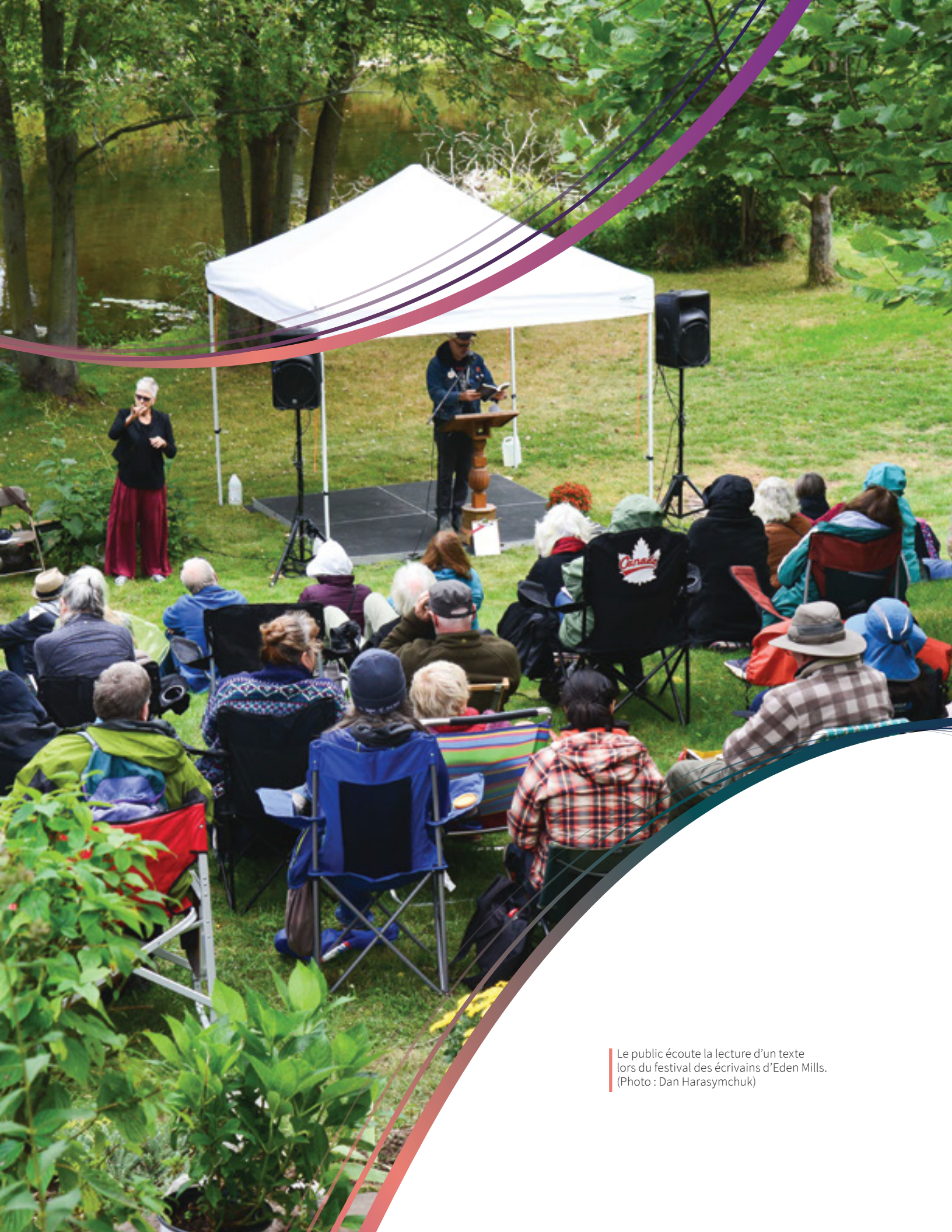
Le public écoute la lecture d'un texte lors du festival des écrivains d'Eden Mills.