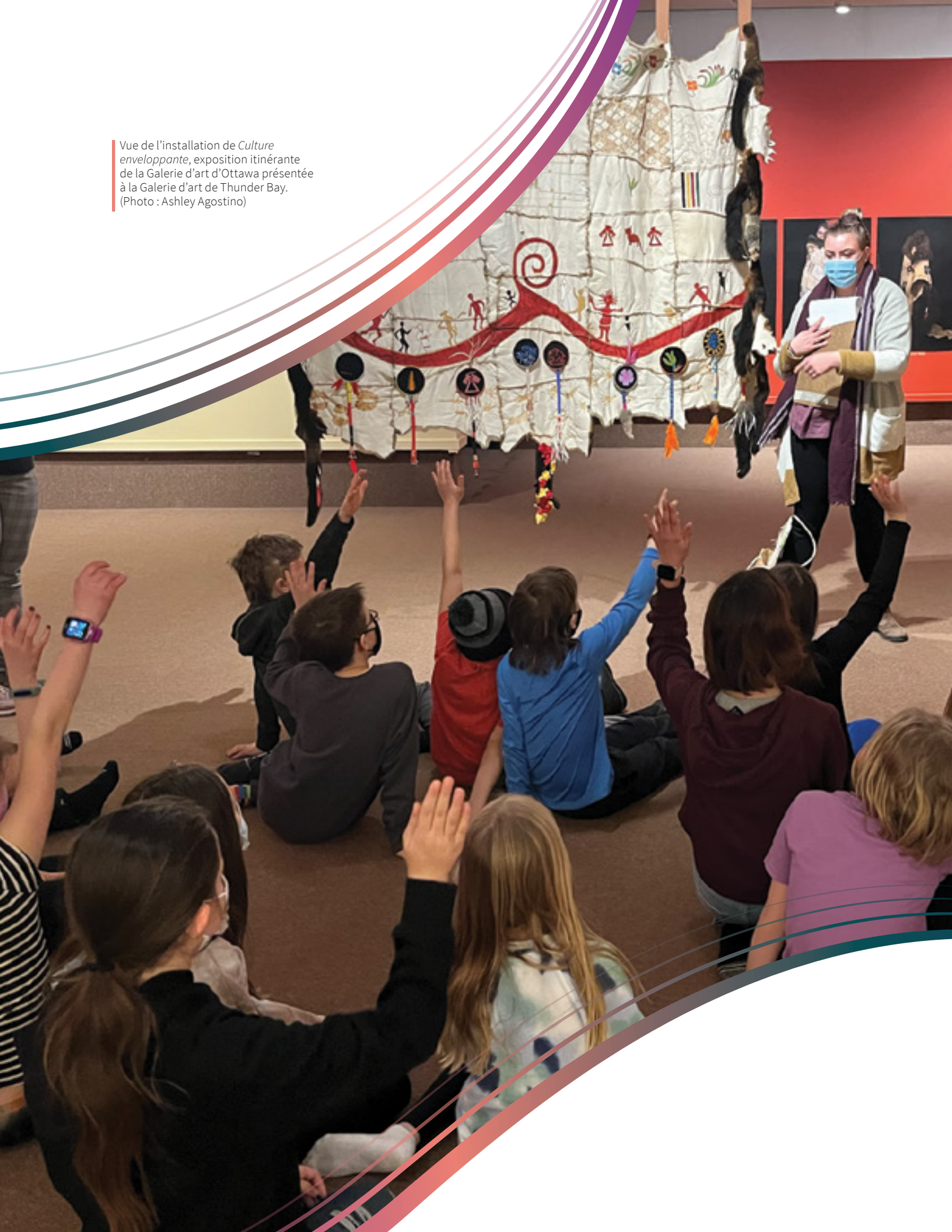
Vue de l'installation de Culture enveloppante , exposition itinérante de la Galerie d'art d'Ottawa présentée à la Galerie d'art de Thunder Bay.